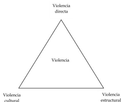
Triángulo de las categorías de violencia