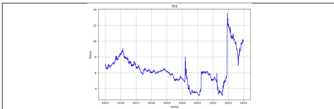
Figura 1. Evolución histórica de los precios de cierre de las acciones Bancolombia, Nutresa, ISA, Grupo Energía Bogotá (GEB) y la rentabilidad del TES (renta fija).