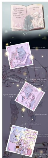
Metáfora y personificación de animales en Mis días contigo (Y sin ti)